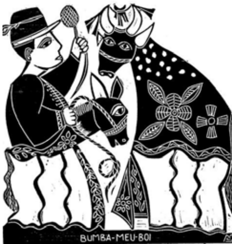
Xilogravure traditionnelle du Nordeste du Brésil