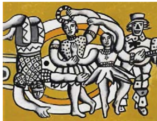
Tableau de Fernand Léger