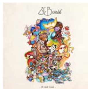
ZÉ BOIADÉ, 2016 LA RODA, RUE STENDHAL