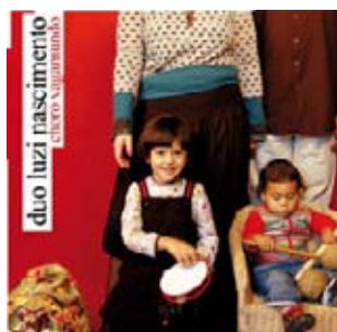
CHORO VAGAMUNDO, 2012 LA RODA