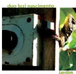
JARDIM, 2007 LA RODA