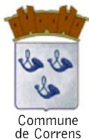
Commune de Correns